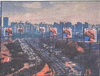
변경 후 (디지털, 세로형)